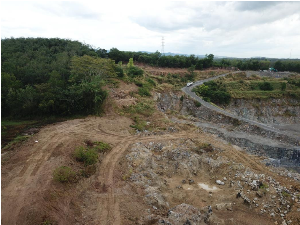
① สภาพพื้นที่โครงการเมื่อมองไปทางด้านทิศตะวันออกเฉียงใต้