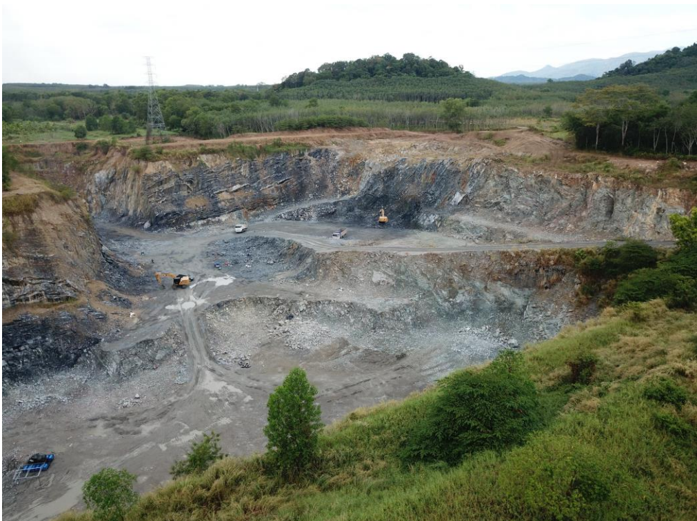
② สภาพพื้นที่โครงการเมื่อมองไปทางด้านทิศตะวันตก

รูปที่ 1-2 (ต่อ) แสดงขอบเขตพื้นที่โครงการและสภาพพื้นที่ปัจจุบัน